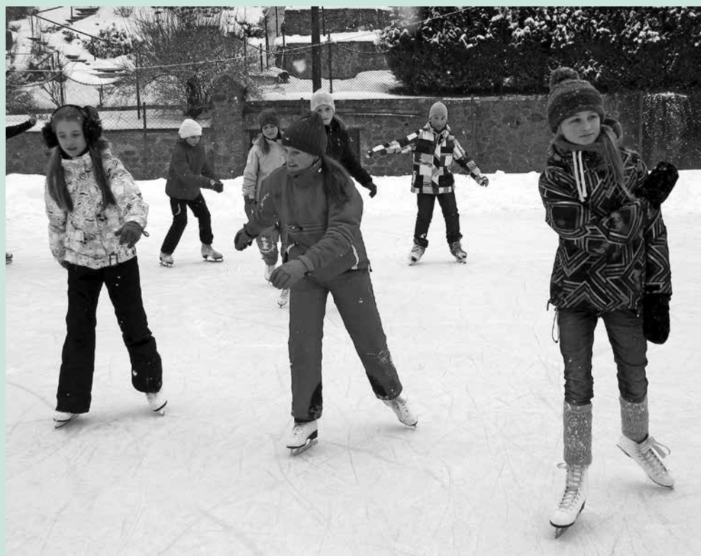
Bruslení za sokolovnou, leden 2013