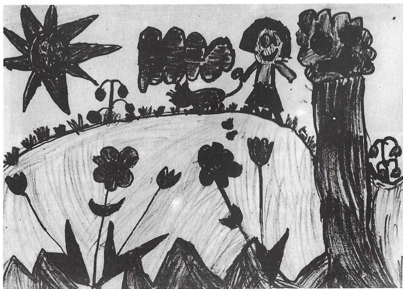
Eliška Podlipná, 6 let.