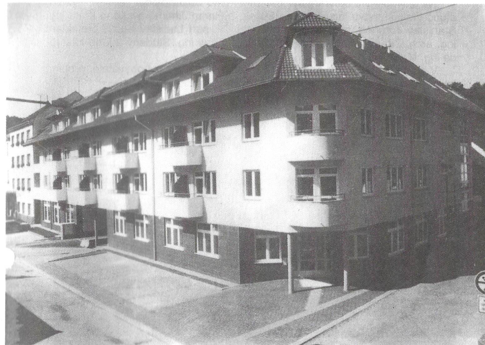
Dům s pečovatelskou službou.

VYDÁVÁ ZASTUPITELSTVO OBCE BÍLOVICE NAD SVITAVOU