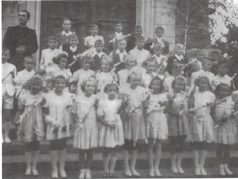
Fotografie všech aktérů 1. sv. přijímání v roce 1947 a 1977.