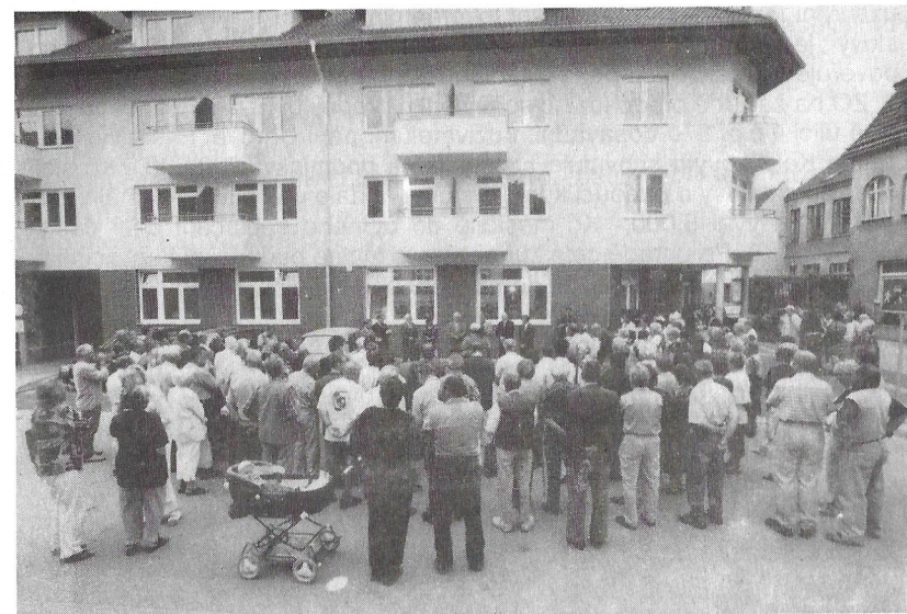
Občané při slavnostním otevření dne 10. července 2003.