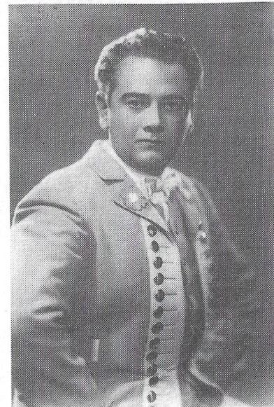
Prodaná nevěsta – Jeník 24. října 1936