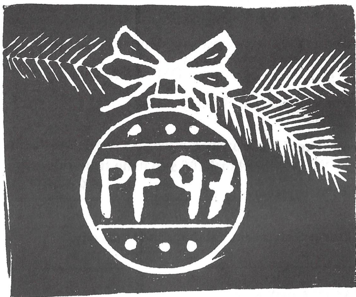
Linoryt PF 97. M. Sehnalová, 9. třída.

Hvězdička stříbrná nám zase po roce přináší stromeček, přináší vánoce.