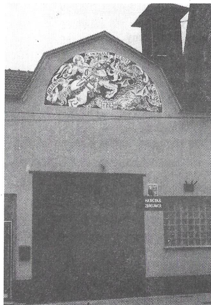
Obnovený obraz na hasičské zbrojnici, Sv. Jiří.

Sbor dobrovolných hasičů v Bílovicích v I. pololetí letošního roku pracoval v rámci svých povinností převážně na úseku represe. V obci byl 12. 4. vyhlášen požární poplach, hořela stodola v Ochozu, účastnili se 4 dospělí a 3 starší žáci. Jednotka přijela na místo požáru za 15 minut, nemusela však zasahovat, poněvadž požár byl likvidován z cisteren útvarem z Pozořic.