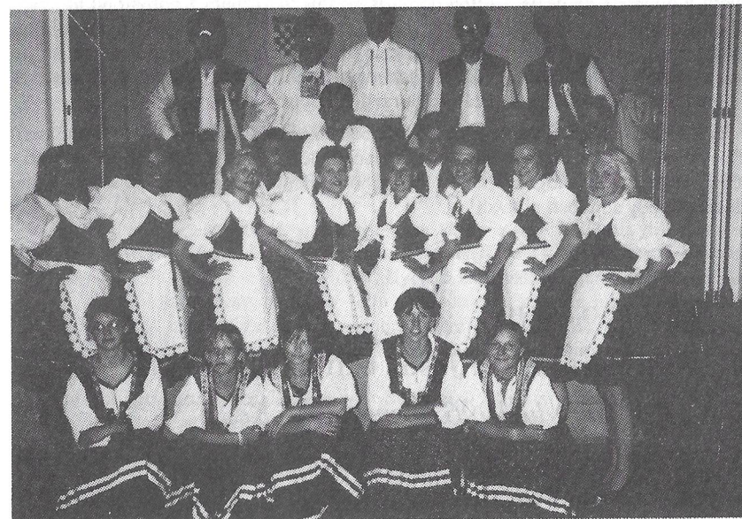
Soubor Moravský kalíšek.

Odpoledne jsme pak přijeli do Rijeky, kde se nás ujali manželé Tadičovi s p. prof. Dobrilou Řehákovou. Navštívili jsme hrad Trsat - dominantu města, vyslechli jsme jeho historii a navštívili jsme Františkánský klášter, kde nás zaujala především kaple p. Marie - Majka Božie, kde námořníci při odjezdu na moře darovali obrazy, své fotografie a různé předměty, aby je p. Marie na moři ochránila a opět se vrátili domů. Hodinu jsme měli na prohlídku několika náměstí, městské věže a nábřeží, po té jsme odjeli do Opatie - největších přímořských lázní na Jadranu. Prohlédli jsme si část kolem pláže, nahlédli do dvoran krásných hotelů, obdivovali místní květenu a natrhali si ze stromů pravý bobkový list.