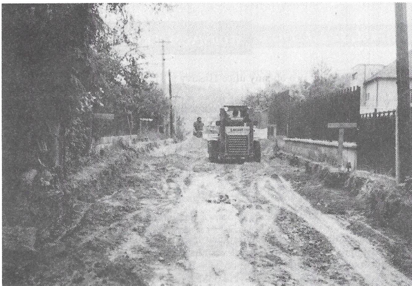
Práce na Jiráskově ulici.

Podařilo se a dnes jsou na Jiráskové všichni napojeni na vodu, plyn i kanalizaci, je položen kabel telefonu a mohlo se tedy začít jednat o stavbě.