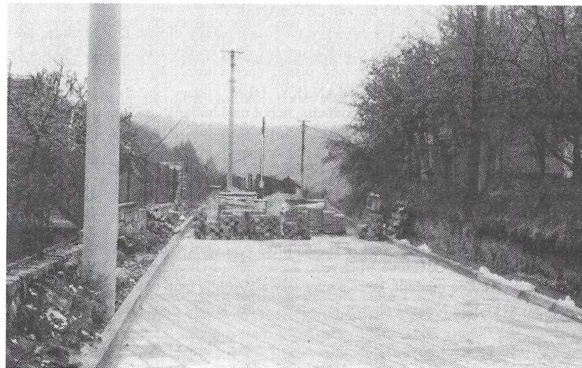
Dokončující práce na Jiráskově ulici.

celou dobu výstavby nedošlo k narušení vody, plynu, nebyl zničen žádný plot, což je dle mých zkušeností věc ojedinělá a svědčí o dobré práci dodavatele a dobré činnosti dozorů a zmíněných pracovníků obce.