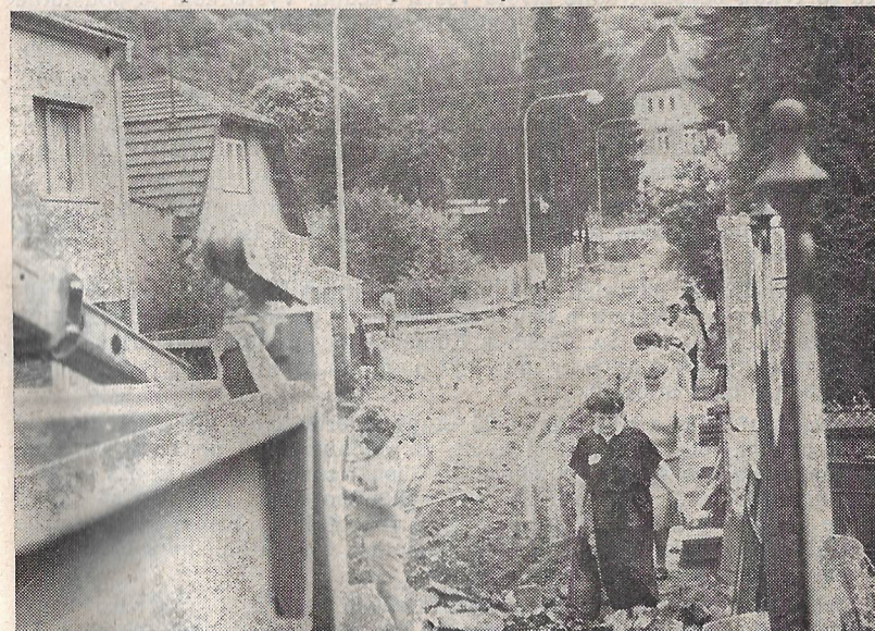
Rekonstrukce komunikace na Komenského ulici.

V žádném případě se nejedná o přesný účetní výčet s uvedením finančních nákladů, ale pouze o souhrnný velmi stručný přehled. Vždyť například „plynofikace obce“ se vyjádří dvěma slovy, ale kolik tato jediná věc vyžadovala úsilí a práce, to dovede posoudit jen málo lidí.