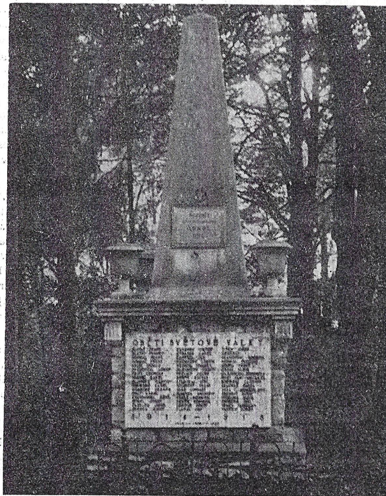
Text k fotografii na 2. straně pod čarou.

VYDÁVÁ INTEGROVANÝ MNV BÍLOVICE n/SVITAVOU PRO OBCE BÍLOVICE n/SVIT., KANICE, ŘÍCMANICE